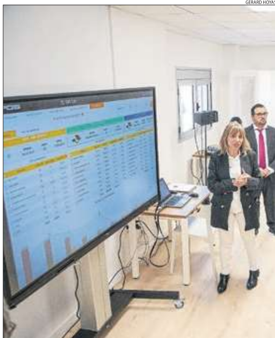
L'aula té un sistema de gestió i planificació de comandes.

És un espai pioner a Catalunya amb punts de venda tàctils, sistemes de pagament automàtic i programes de gestió de torns || Amb inversió d'ICG i institucions, formarà tant professors com alumnes